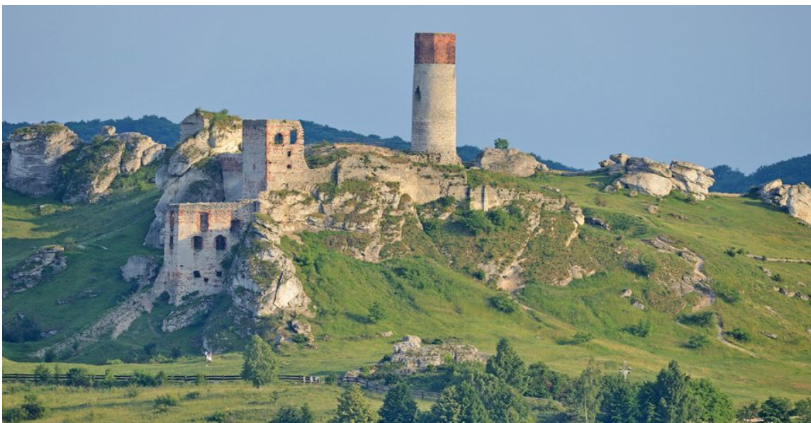
Ruiny zamku w Olsztynie

Po kolejnych 2 km docieramy do Olsztyna. Miejscowość ta słynie przede wszystkim z ruin XIV-wiecznego zamku (H) , wybudowanego w systemie tzw. Orlich Gniazd - warowni strzegących granic Królestwa Polskiego. Ruiny dostępne są dla zwiedzających, u podnóża zamku można zjeść smaczny posiłek i ugasić pragnienie w licznych punktach gastronomicznych.