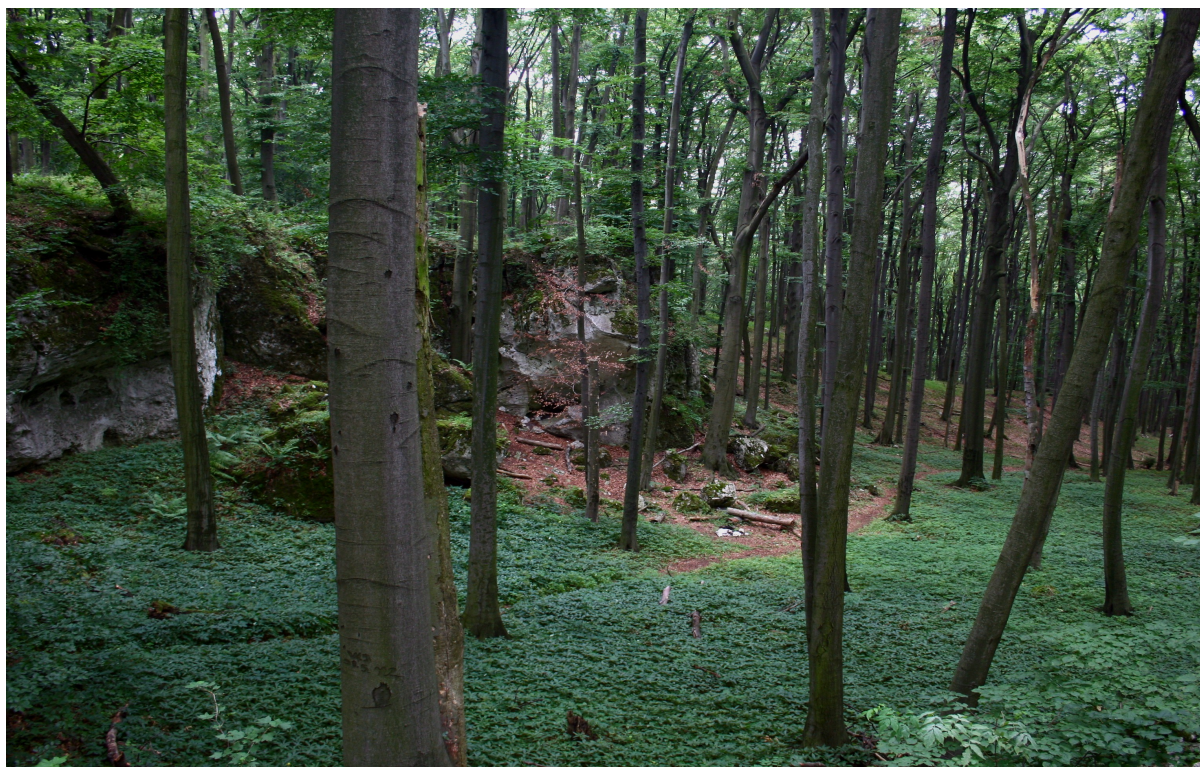
Rezerwat Sokole Góry