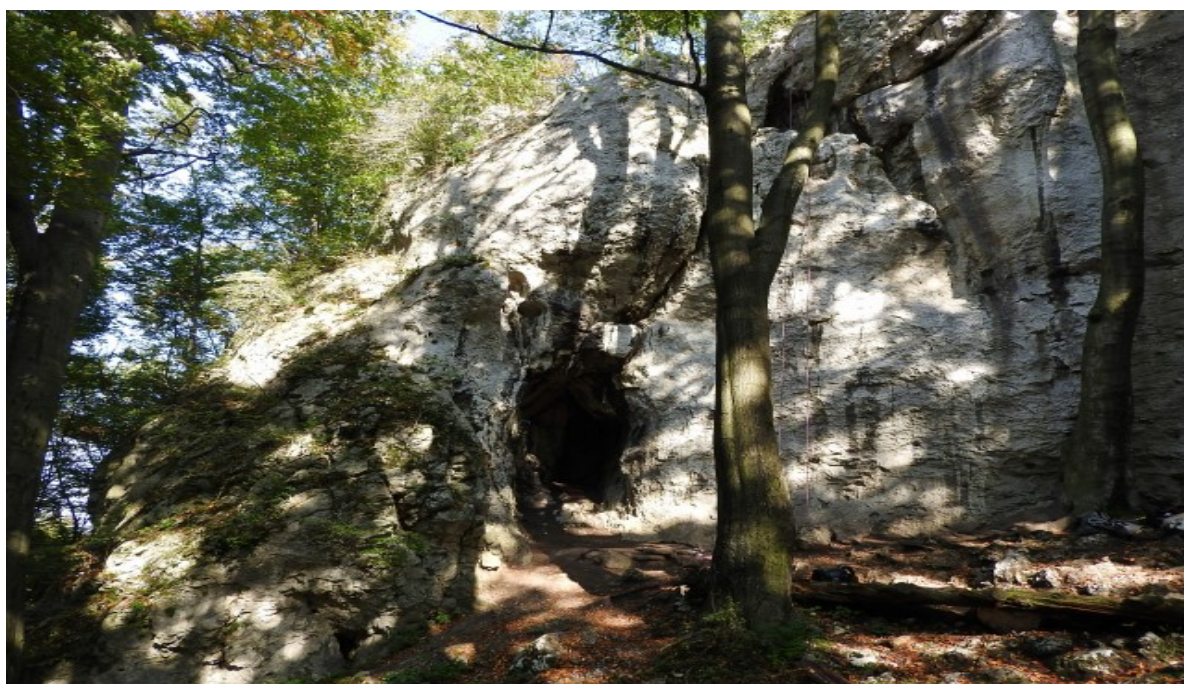
Rezerwat Sokole Góry

Rezerwat Sokole Góry jest ostatnim punktem proponowanej przeze mnie wycieczki. Jeżeli kogoś bardzo zmęczyła przemierzona trasa, do Częstochowy może wrócić z Olsztyna autobusem MPK, które w sezonie letnim (w weekendy) uruchamia specjalną linię autobusów wyposażonych w przyczepę dostosowaną do przewozu rowerów.