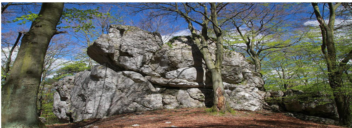
Rezerwat Sokole Góry

Jedziemy ok. 2 km drogą na Biskupice (ul. Kúchna). Po lewej stronie zatrzymujemy się na parkingu przy Rezerwacie Przyrody Sokole Góry (J) . Rezerwat zajmuje powierzchnię 216 ha i obejmuje skupisko jurajskich wzniesień, które stanowią wapienne wzgórze przykryte lessem. Główne wzniesienia osiągają ok. 400 m n.p.m. i są to: Góra Sokola, Góra Setki, Pustelnica oraz Puchacz. Góry Sokole kryją w sobie kilkadziesiąt jaskiń, wśród których najstynniejszymi są: Jaskinia św. Maurycego, Koralowa, Pod Sokolą Górą, Studnisko, Olsztyńska i Wszystkich Świętych. Rezerwat jest idealnym miejscem zarówno dla zwolenników spokojnych spacerów, jak i miłośników ekstremalnych wrażeń: kolarstwa górskiego, wspinaczki, eksploracji jaskiń.