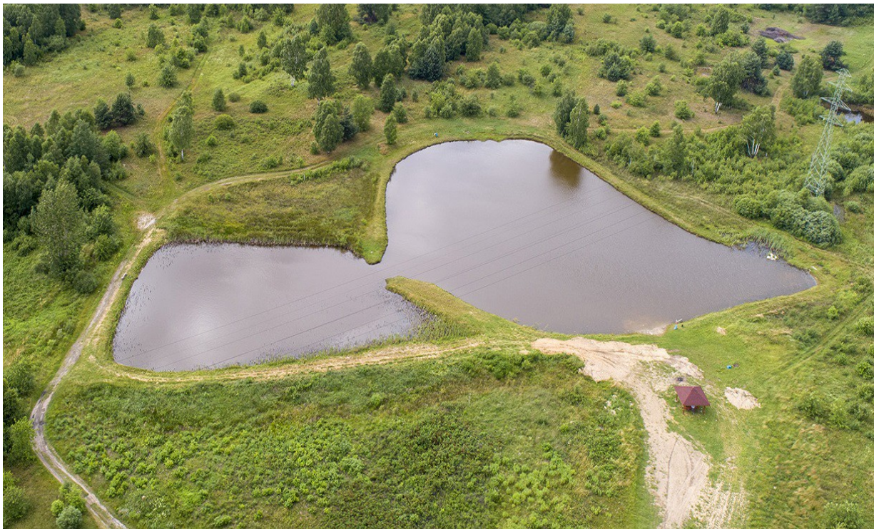
Jeziorko Krasowe w Kusiętach

Dojeżdżamy do końca ul. Legionów i skręcamy w lewo, w ul. Brzyszowską. Jadąc cały czas główną drogą (przejeżdżamy przez Srocko), w miejscowości Brzyszów skręcamy w prawo na Olsztyn, zgodnie z drogowskazem. Wjeżdżamy do Kusiąt. Ok. 150 m przed przejazdem kolejowym skręcamy w prawo. Po ok. 1 km docieramy do Jeziorka Krasowego (F) . Jeziora krasowe to niezwykła rzadkość w Polsce, występują jeszcze tylko na Wyżynie Lubelskiej. Powstają w leju krasowym, który w plejstocenie został przykryty kilkumetrową warstwą nierozpuszczalnych osadów - glin i piasków polodowcowych, które jednocześnie są nieprzepuszczalne dla wody. Jezioro krasowe w Kusiętach to zaciszne, piękne przyrodniczo miejsce, gdzie możemy zatrzymać się i odpocząć przed dalszą drogą.