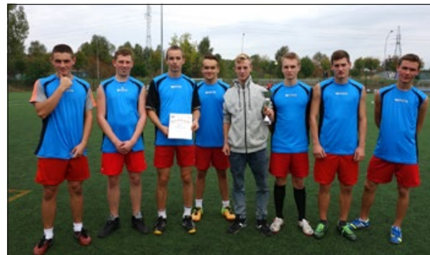
Drużyna ZS Mech-Elektrycznych – II miejsce