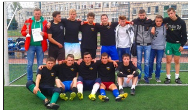
Drużyna ZS KOchanowskiego – I miejsce

Z półfinału dwie pierwsze drużyny rozegrały finał o miejsca I – IV, pozostałe zespoły rozegrały finał o miejsca V – VIII.