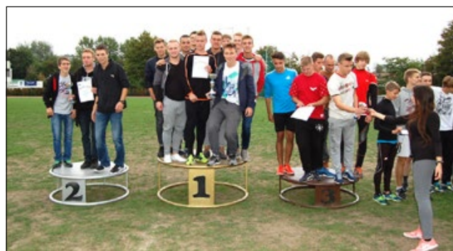
Punktacja drużynowa chłopców: I m - ZSTIO; II m - TZN; III m - III LO Biegańskiego