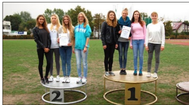
Najlepsze zespoły sztafet 4 x 100 m dziewcząt