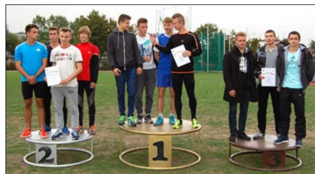
Najlepsze sztafety chłopców