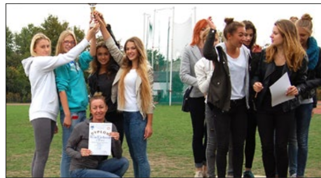
Punktacja drużynowa dziewcząt: I m - II LO; II miejsce - IV LO