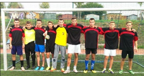
Drużyna VII LO Kopernika – IV miejsce