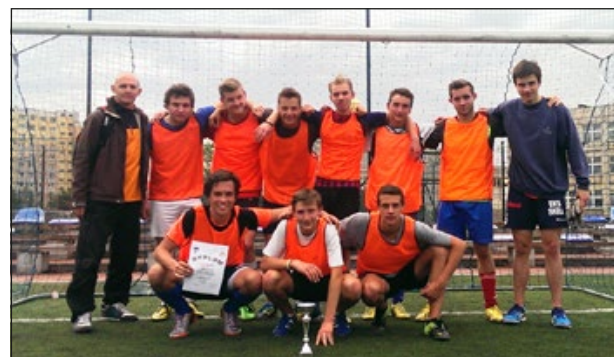
Drużyna II LO Traugutta – III miejsce