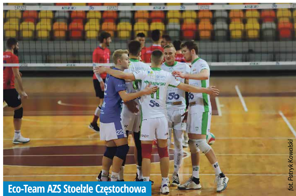
Eco-Team AZS Stoelzle Częstochowa

W poprzednim spotkaniu w ramach 11. kolejki PKO Ekstraklasy Czerwononiebiescy pokonali Wartę Poznań 1:0. Bramkę na wagę zwycięstwa strzelił Vladislav Gutkovskis. Raków znów objął pozycję lidera, mając 1 punkt przewagi nad Legią Warszawa.