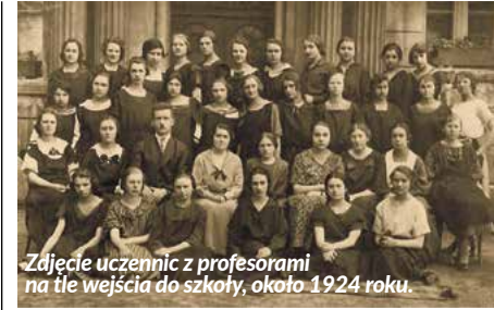
Zdjęcie uczennic z profesorami na tle wejścia do szkoły, około 1924 roku.