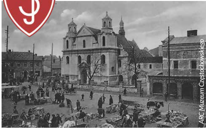
ARC Muzeum Częstochowskiego