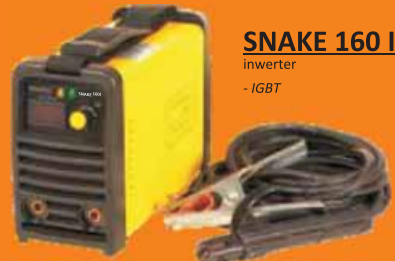
SNAKE 160 I inwerter - IGBT

Spawarki inwerterowe MAGNUM charakteryzują się: niewielkimi rozmiarami i wagą, wysoką sprawnością oraz energooszczędnością.