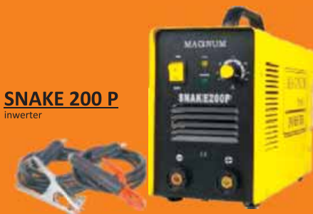
SNAKE 200 P inwerter