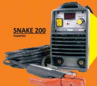
SNAKE 200 inwerter