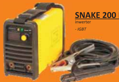
SNAKE 200 I inwerter - IGBT