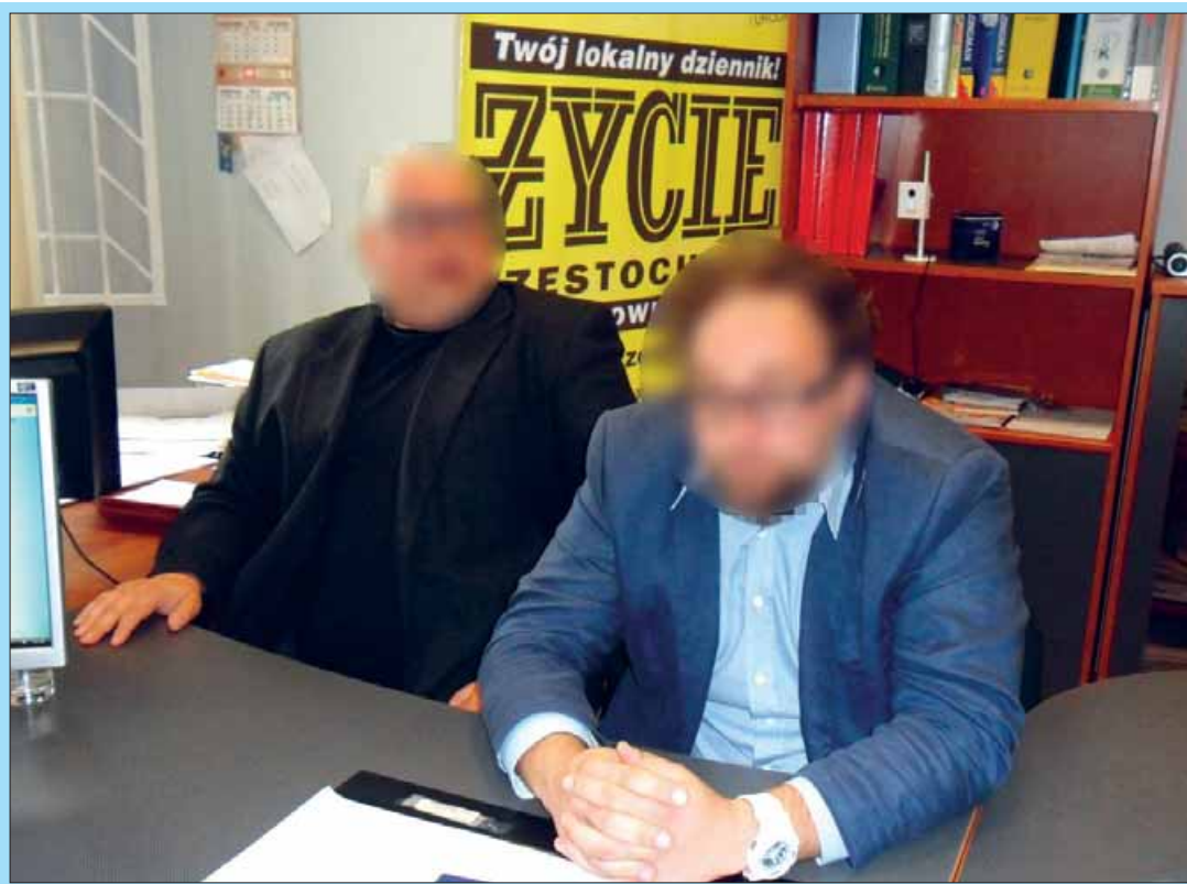
Rozmawiamy z właścicielami biura detektywistycznego Bernn.

Obecnie posiadamy trzy oddziały, centralna mieści się w Częstochowie, ponadto posiadamy oddziały w Katowicach i Warszawie, dzięki temu możemy wykonywać czynności detektywistyczne na terenie całego kraju.