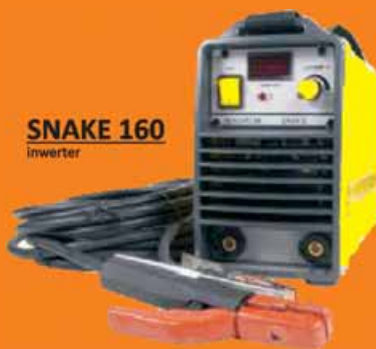
SNAKE 160 inwerter