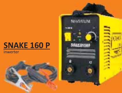
SNAKE 160 P inwerter