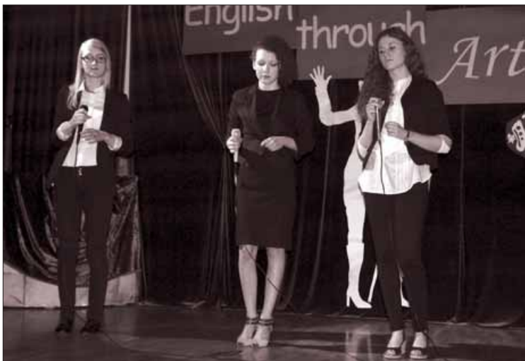
Grupa Venus Trio – wyróżnienie w części wokalnej