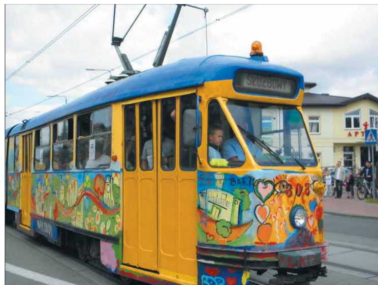
W zabytkowym tramwaju pojawili się przedstawiciele OPP