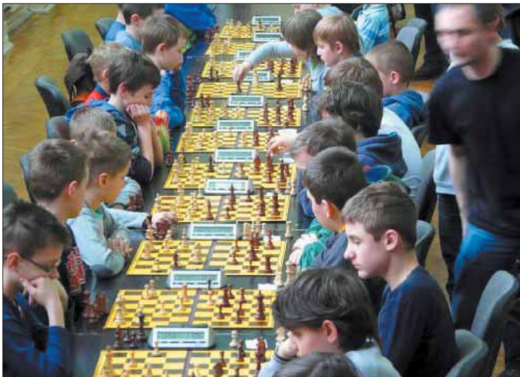
W igrzyskach wystartowało 15 najlepszych drużyn