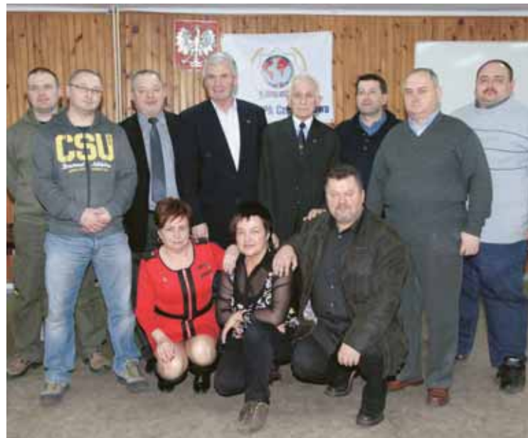
IPA wybrała nowy zarząd