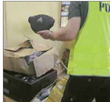
Policjanci zabezpieczyli m.in. poduszki powietrzne i pasy bezpieczeństwa

duszki powietrzne samochodów różnych marek, duże ilości pasów bezpieczeństwa, radioodtworacze, kokpity oraz inne elementy samochodowe. Jak ustalili śledczy, elementy te pochodzą z kradzieży na szkodę jednej z częstochowskich firm. Odzyskane rzeczy i zatrzymany paser to efekt pracy operacyjnej częstochowskich policjantów. Trwają dalsze ustalenia dotyczące osób związanych z kradzieżą na szkodę tej firmy. Zatrzymany 30-letni paser usłyszał już prokuratorskie zarzuty paserstwa umyślnego za co grozi mu do 5 lat więzienia. Mężczyzna został objęty dozorem