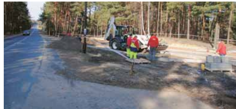
Ekipy budowlane przygotowują teren pod parking