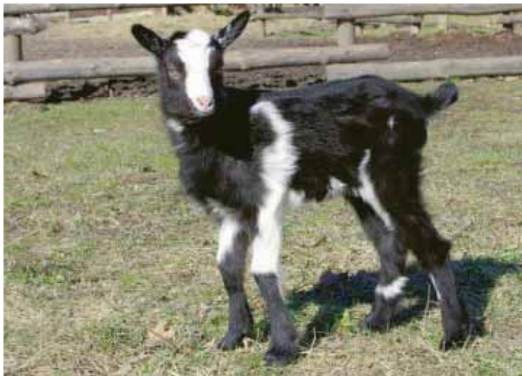
Koziczka czeka na imię

czas finału oraz wybrana losowo spośród głosujących - zostaną honorowo mianowane przez dyrektora muzeum Andrzeja Sośnierza chrzestnymi maluszka. ŚWU