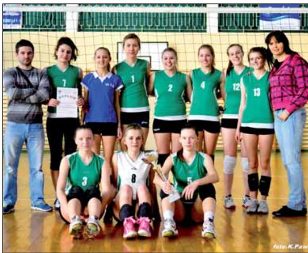
Drużyna IX LO im. C. K. Norwida – I miejsce

Drużyna ta będzie reprezentować nasze miasto w dalszych rozgrywkach najpierw w zawodach rejonowych spotykając się z najlepszymi drużynami z rejonu Kłobucka oraz z rejonu ziemskiego. Zwycięzca zawodów rejonowych spotka się w półfinale mistrzostw śląska z drużynami z rejonu Sosnowca, Będzina i Dąbrowy Górniczej. Drużyna zajmująca pierwsze miejsce w tym półfinale awansuje do finału mistrzostw śląska gdzie startują 4 najlepsze drużyny z całego województwa śląskiego.