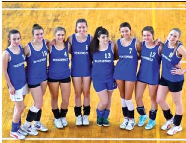
Drużyna V LO im. A. Mickiewicza – IV miejsce