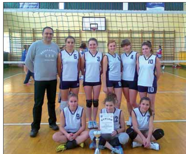
Drużyna VIII LO Samorządowego – III miejsce