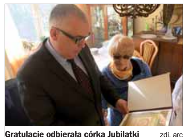
Gratulacje odbierała córka Jubilatki