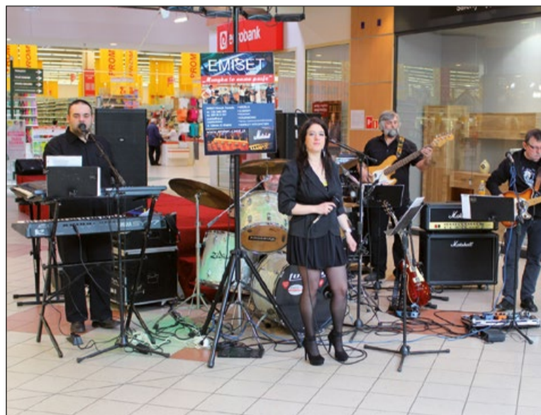
Odwiedzającym targi czas uprzyjemniały zespoły weselne