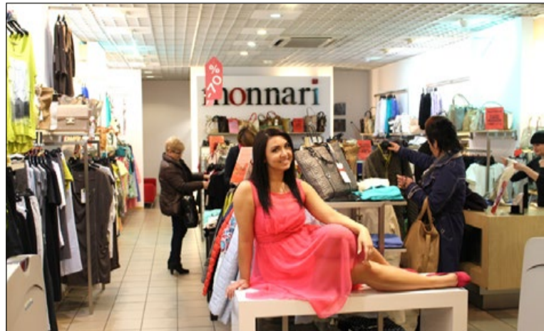
„Żywe manekiny” prezentujące najnowsze kolekcje butików. Można je było zobaczyć zarówno w witrynach sklepowych, jak i na wybiegu