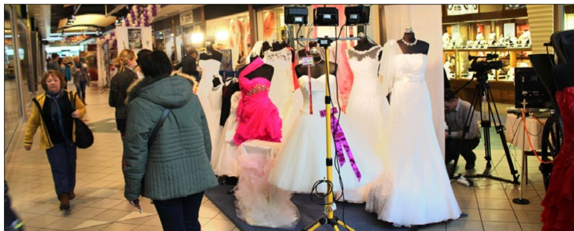
Wybór sukni ślubnych był bardzo szeroki