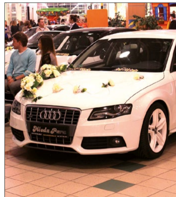
Jak ślub, to tylko limuzyna...