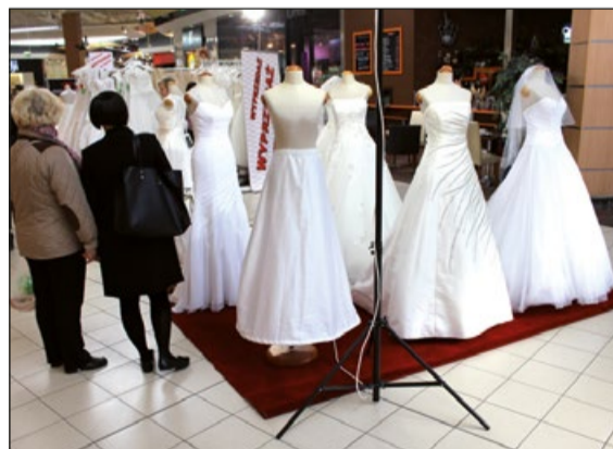
Suknie jak z bajki