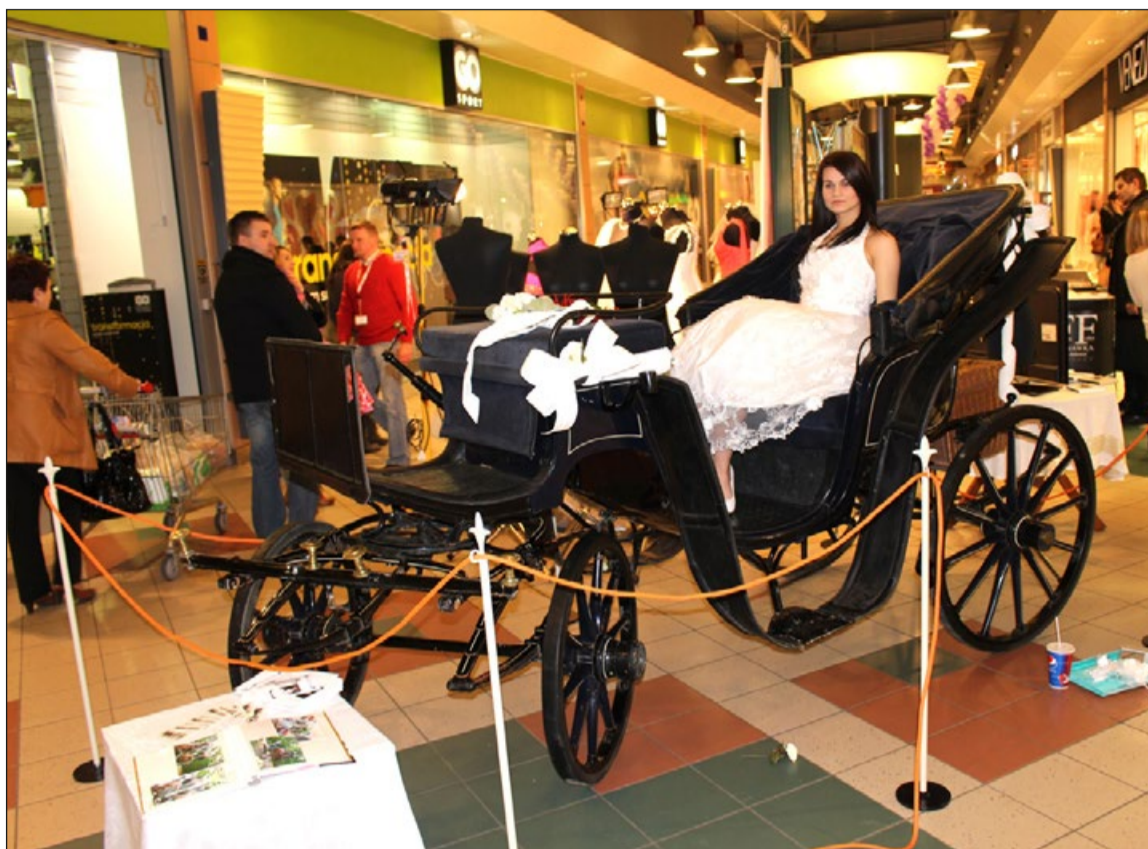
Po pokazie mody przyszedł czas na kilka zdjęć