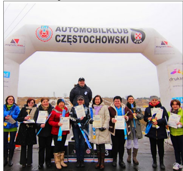
Panie doskonale radzą sobie za kierownicą. Udowodniły to podczas zeszlorzecznej rywalizacji.

Miejskiej Policji w Częstochowie, a także licznym wolontariuszom, którzy są pozytywnej zakręcenii na punkcie motoryzacji, możemy zaprosić mieszkanki Częstochowy na naszą imprezę. To dzięki nim taka inicjatywa nie zatrzymała się na etapie marzeń i stała się rzeczywistością - mówi Romuald Nowakowski, dyrektor zawodów.