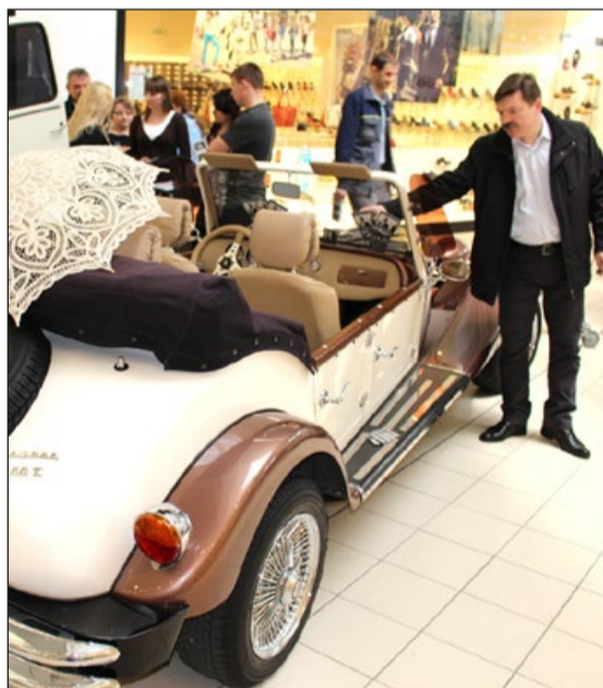
A może ślub retro?