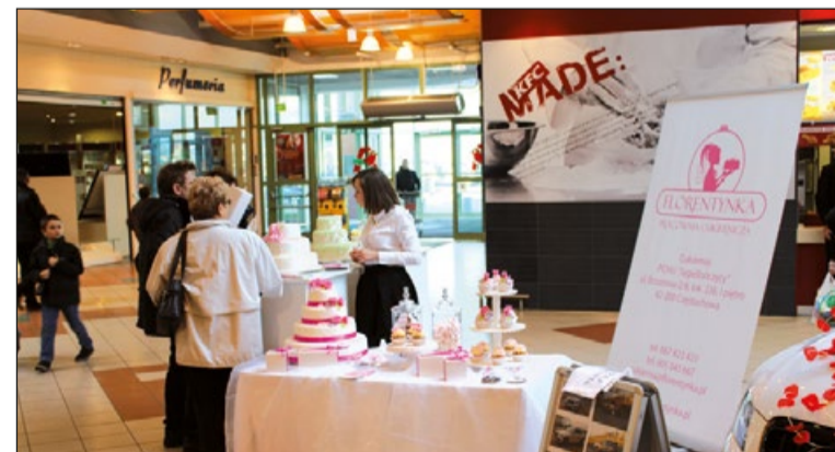
Na osłodę świeże wypieki częstochowskiej cukierni