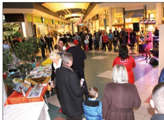
Zainteresowanie Targami było ogromne