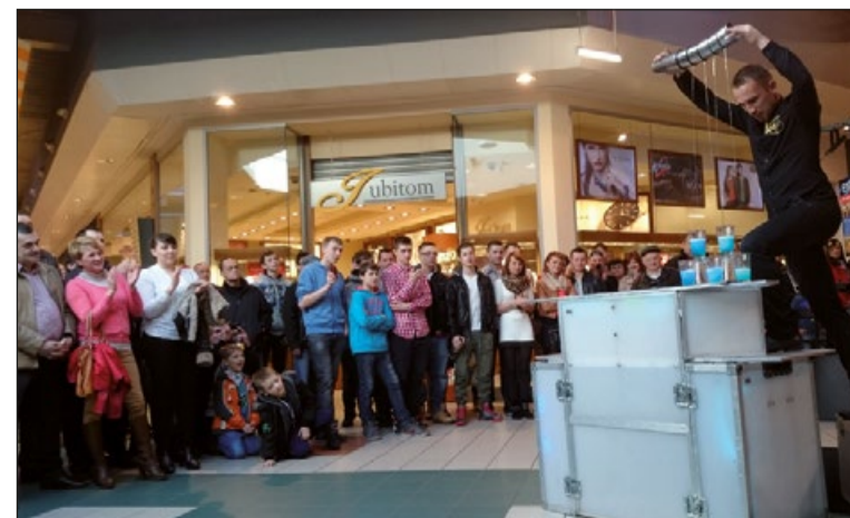
Z pokazu barmańskiego