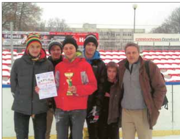
I miejsce – drużyna Gimnazjum nr 18