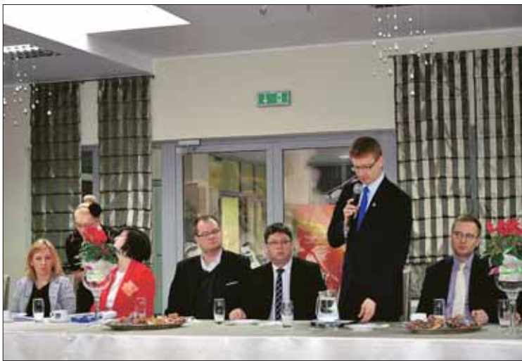
Na spotkaniu rozmawiano o kolejnych ulgach

ków, już powstało lub powstanie w mieście kilkadziesiąt nowych miejsc pracy. W sumie ze zwolnień na razie skorzystało 9 firm. Szacowana łączna kwota zwolnienia z podatku od nieruchomości w latach 2011-2021 związana tylko z wnioskami już złożonymi na bazie obecnych i wcześniej funkcjonującej uchwały wyniesie prawie 14,6 mln zł, w tym w ramach pomocy de minimis 1,6 mln zł oraz w ramach pomocy regionalnej blisko 13 mln zł.