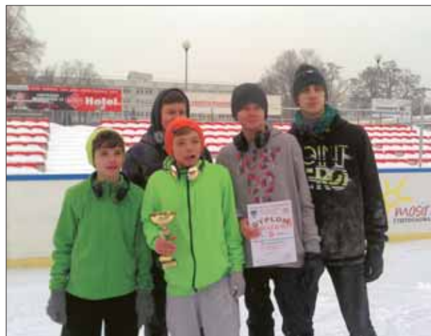
II miejsce – drużyna Gimnazjum nr 14