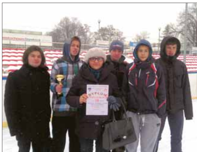
III miejsce – drużyna Gimnazjum nr 12