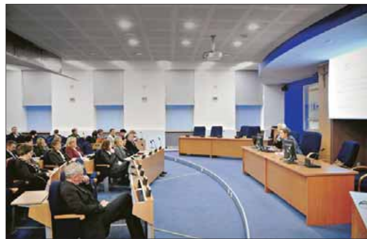
W magistracie opowiadano o mobbingu

w praktyce, ale także ze względu na obawę przed odwetem ze strony pracodawcy. W związku z tym poszkodowany pracownik często idzie prosto do sądu, nie szukając możliwości polubownego rozwiązania konfliktu z pracodawcą, co naraża obydwie strony na wydatki i długotrwałe postępowanie sądowe. Tymczasem pracodawca podejmując odpowiednie działania prewencyjne może nie tylko uniknąć niepotrzebnych konfliktów wśród pracowników, ale także skutecznie realizować kodeksowy obowiązek przeciwdziałania dyskryminacji i mobbingowi w zatrudnieniu, w niektórych przypadkach nawet unikając odpowiedzialności prawnej za nieuprawnione działania swoich pra-