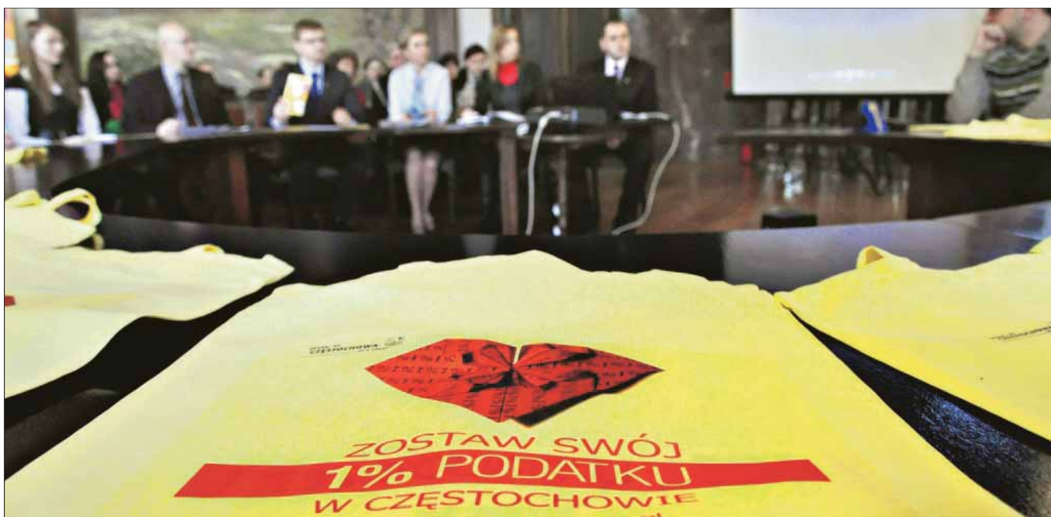
Miasto zachęca mieszkańców do wspierania jednym procentem podatku lokalnych organizacji pozarządowych